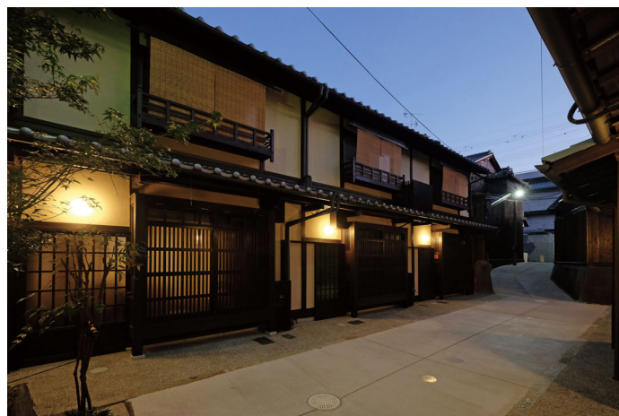
通り景観の修景事例