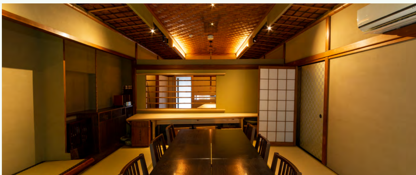
▲ AFTER お座敷からバーカウンターを臨む